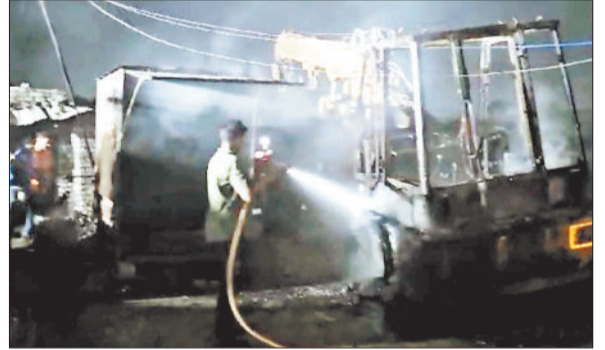
आग को बुझाता फायर ब्रिगेड का अमला।

रविवार की देर रात पेट्रोल पंप में उस समय हड़कंप मच गया था जब पेट्रोल पंप के बाहर खड़ी एक डीजी जेनरेटर गाड़ी में शॉर्ट सर्किट से आग लग गई और आग देखते-देखते विकराल रूप ले लिया और