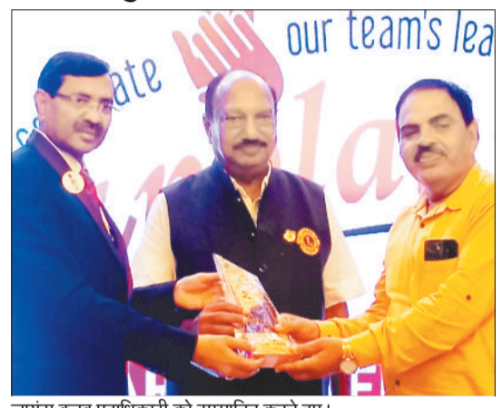
लार्यंस क्लब पदाधिकारी को सम्मानित करते हुए।