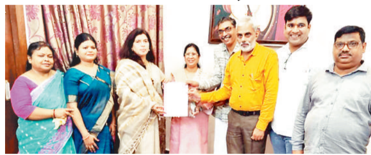
ज्ञापन सौंपते केएन कालेज के शिक्षक।

कमला नेहरू महाविद्यालय के शिक्षकों को मिल रहे अल्प वेतन को लेकर भारतीय जनता पार्टी की राष्ट्रीय उपाध्यक्ष, पूर्व सांसद डॉ. सरोज पांडे, को ज्ञापन सौंपा सह मांग पत्र सौंपा है जिसमें वेतन वृद्धि या शासकीय कारण करने की मांग रखी है। चुनाव उपरांत से ही डॉ सरोज पांडेय कोरबा लोकसभा क्षेत्र में सक्रिय हैं, मतदाताओं का विधानसभा वार सम्मान समारोह आयोजित कर सबका अभिनंदन कर रही है प्रवास के दौरान कावेरी रेस्ट हाउस एनटीपीसी में प्रतिनिधिमंडल उनसे मिला।