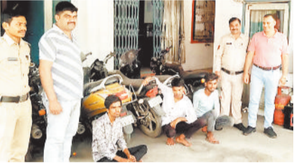
पुलिस गिरफ्त में आरोपी व जप्त सामान।