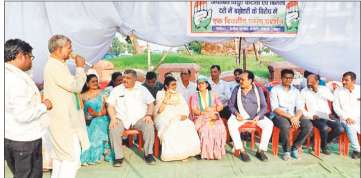
धरना को संबोधित करते महापौर।

भाजपा सरकार समय पर बिजली नहीं दे पा रही है। बिजली के दरों में 8 प्रतिशत की बढ़ोतरी कर दी है। यह नियम आम जनता पर अत्याचार है। प्रदेश की जनता महंगाई से पीड़ित है, इस दशा में बिजली के दर में बढ़ोतरी करना महंगाई से जख्मी जनता के जख्मों पर नमक छिड़कना है। प्रदेश की भाजपा सरकार को बिजली दर में 8 प्रतिशत की बढ़ोतरी को वापस लेना चाहिए।