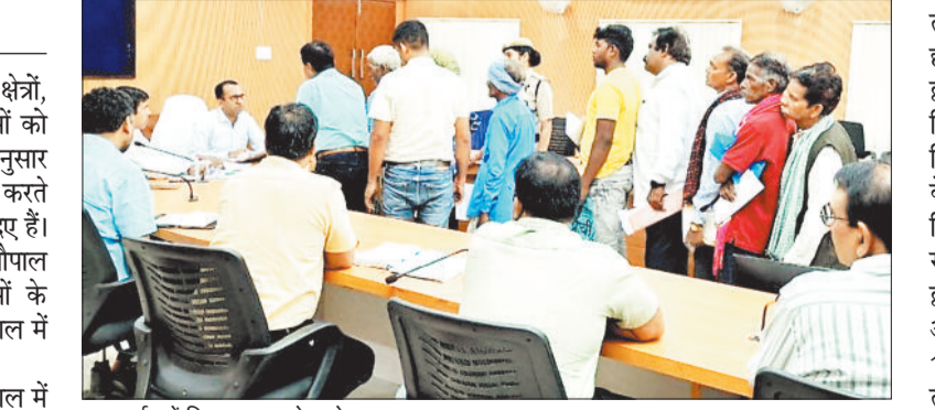
जनदर्शन में शिकायत सुनते कलेक्टर।

कलेक्टर जन चौपाल में जिले के दूरस्थ क्षेत्रों, वनांचलों से आए लोगों की समस्याओं को गंभीरता से सुना। उन्होंने प्रकरण अनुसार संबंधित अधिकारियों को आवेदन प्रेषित करते हुए नियमानुसार निराकरण के निर्देश दिए हैं। कलेक्टर सभाकक्ष में आयोजित जन चौपाल में लोगों ने अलग-अलग समस्याओं के निराकरण हेतु आवेदन दिया। जन चौपाल में कुल 68 आवेदन प्राप्त हुए।