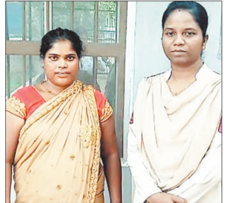
पुलिस गिरफ्त में आरोपी महिला।

मानिकपुर चौकी पुलिस ने की थी तगड़ी सुरक्षा घेरा, जिसके चलते महिला भागने में नहीं हो पायी कामयाब