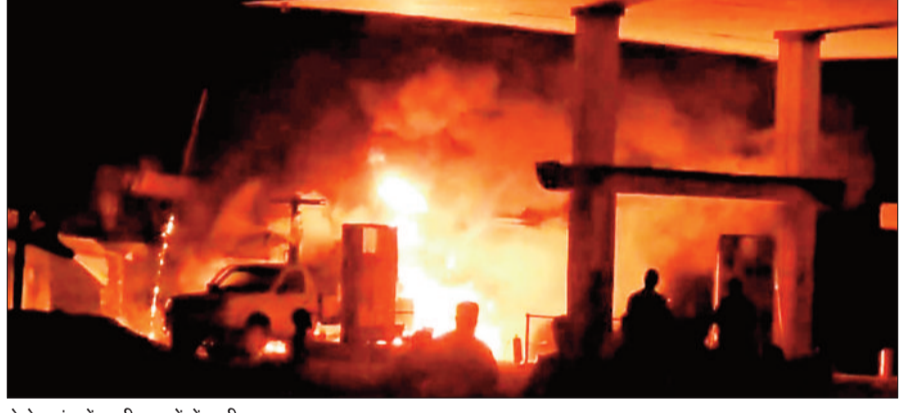
पेट्रोल पंप में खड़ी वाहनों में लगी आग।